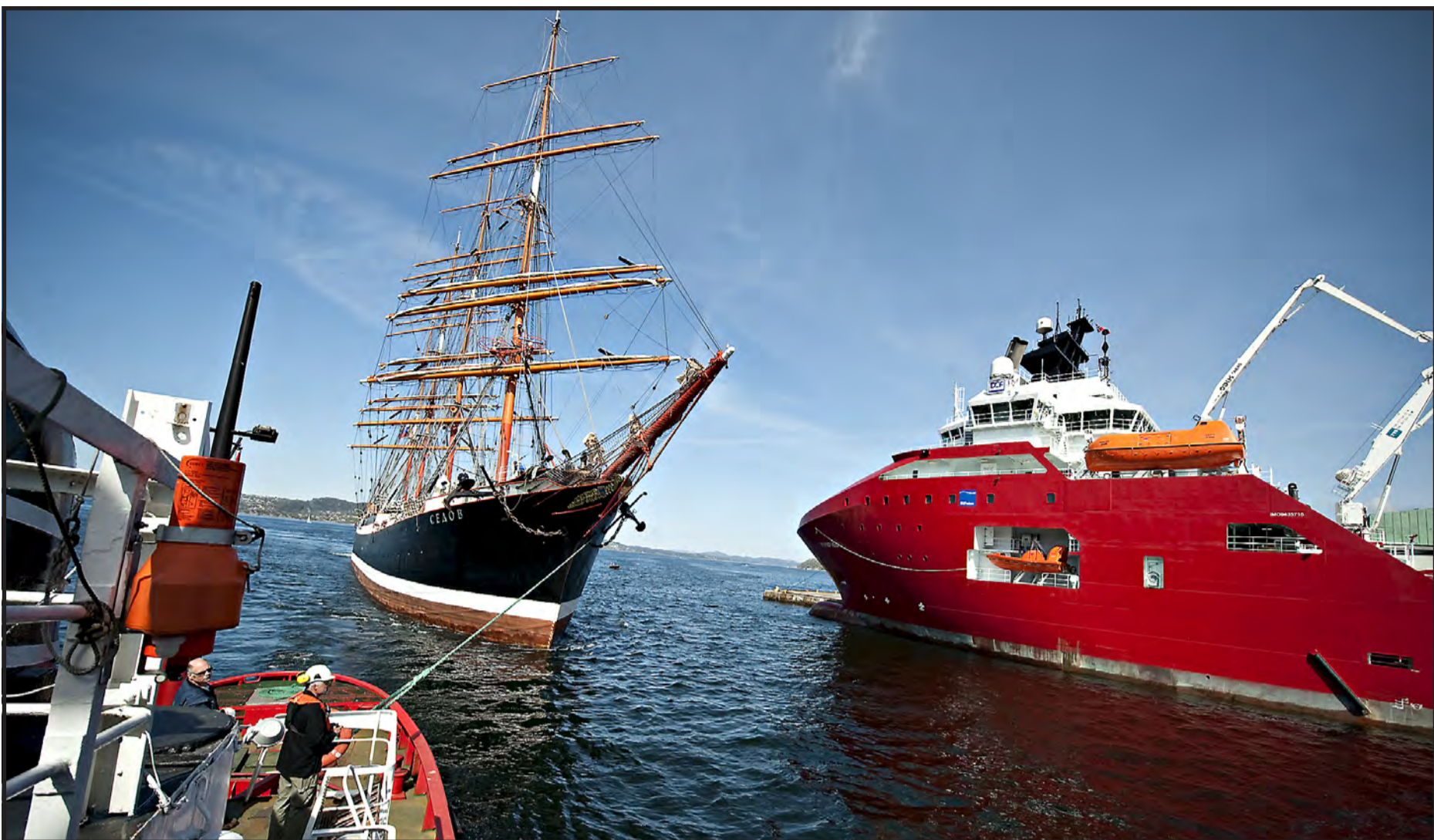
VETERANMØTE: Verdens største seilskute, russiske «Sedov» ble buksert til kaien av veterantauebåten «Vulcanus».