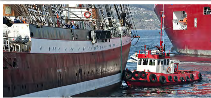
PRESSES: Den lille tauebåten «Beagle» presset «Sedov» hardt mot kaien.