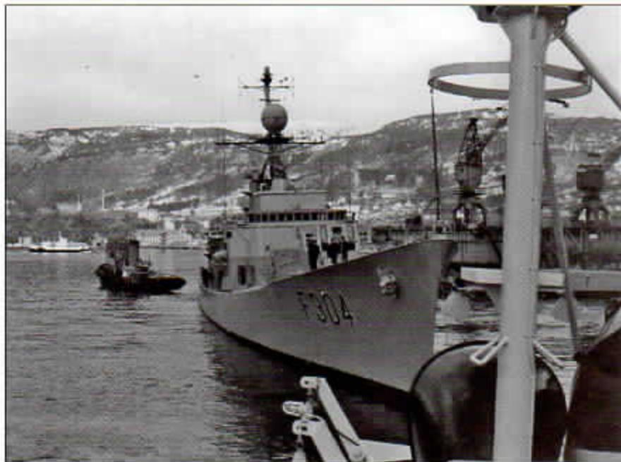
KNM Narvik blir slept ut fra BMV Laksevåg av Samson og Titan, 3. april 1976

slepe det inn til Mobils tank-anlegg i Eidsvåg. Vi gikk rolig ut fra Søndre Tollbodkai og tvers over Vågen til Festningskaaien for å hente en los fra skuret som stod der dengang. Løsen var noen minutter for sent ute og kaptein Schrøder gav ham en lekse jeg aldri har hørt maken til vedr. dette med å møte til rett tid. Men da vi var ute av Vågen var dette glemt og de hadde full fokus på jobben.»