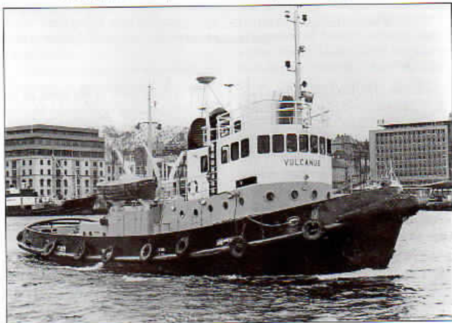
Vulcanus i klassisk stil, foto Dag Bakka jr. 1969.