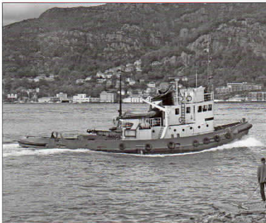
Vulcanus for inngående ved Nordnespynten, slik den er i virksomhet i sitt 50. år.

PS: Er det sant, eller er det bare en myte, at når Titan og Vulcanus var underveis, så var det nøye bestemt hvilken båt som skulle gå først og at båtene skulle gå i formasjon med nærmest bare to meters avstand?