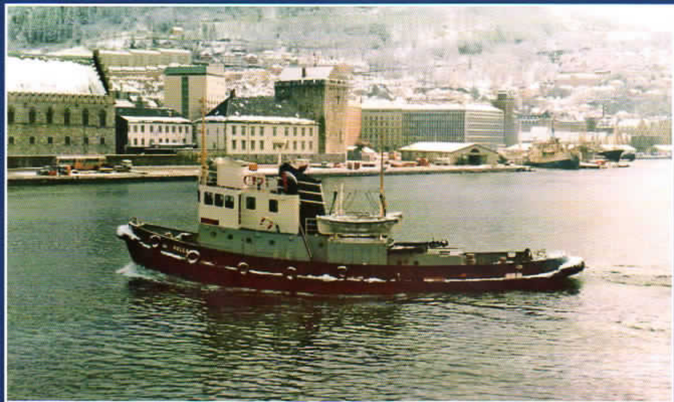
50-årsjubilanten Vulcanus, se side 20, en vinterdag rundt 1976.