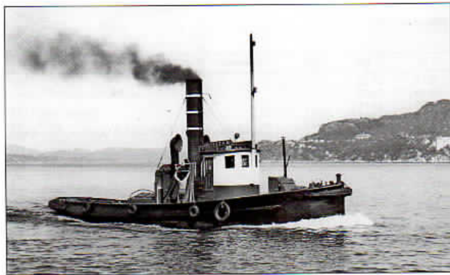
Bergenske hadde hatt slepebåter på havnen i mange år, som Titan fra 1909.

I april kunne Vulcanus markere sitt 50-årsjubileum som slepebåt på Bergen havn. Den ble levert i april 1959 fra Bolsønes Verft i Molde til Det Bergenske Dampskibsselskab, som den gang var et anseelig rederi med 40 skip og 2500 ansatte inklusiv hoteller og landorganisasjon i Bergen. Vulcanus og søsteren Titan, som var levert noen måneder tidligere, skulle være bakkemannskap for virksomheten i hjembyen og gi en hjelpende hånd også ved Bergens Mek Verksteder, der Bergenske var største aksjonær. Gjennom de skiftende tider fra 1959 har Vulcanus vært i full sving, mens verden har forandret seg rundt henne.