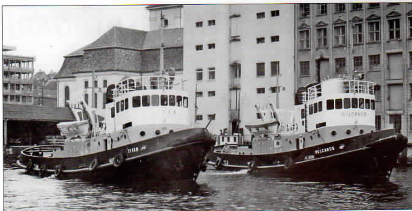
Parbestene Titan og Vulcanus poserer ved Søndre Tollbodkai i 1959.